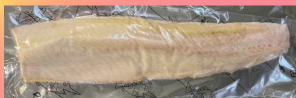
・チョウザメ魚肉