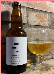
・クラフトビール・ピウカ・ボッチャ など