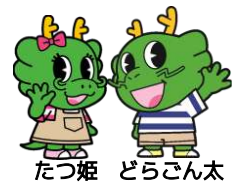
たつ姫 どろごん太