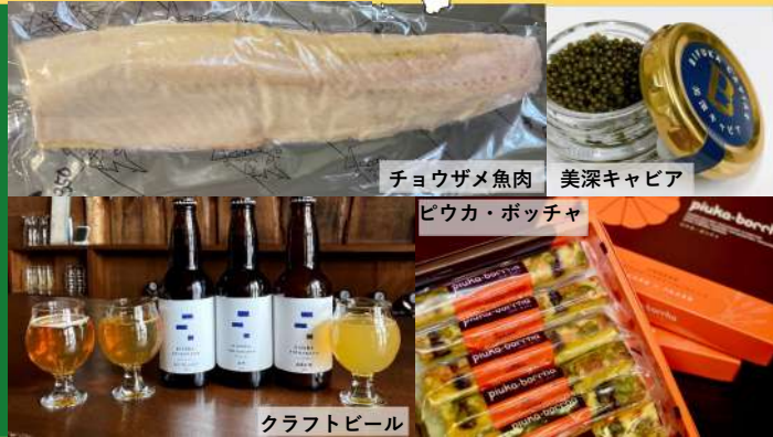
チョウザメ魚肉 美深キャビア

チョウザメ魚肉 / 美深キャビア クラフトビール / チョウザメひれ(ひれ酒用) 太陽の水 / 森の雫 / ピウカ・ポッチャ シラカボ / ソフトブリオッシュ など