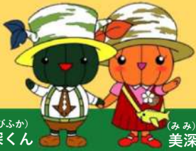
(びふか) 美深くん (みみ) 美深ちゃん

2023年 3月7日(火)11:00~18:00 3月8日(水)11:00~18:00