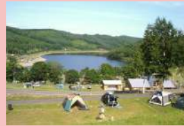
レークサイド桜岡 キャンプ場