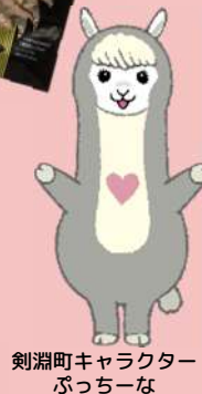
剣淵町キャラクター ぶっちな

剣淵町は、人口約3000人の農業を中心とした町です。「絵本の里」として町おこしをしていて、世界中の絵本約4万冊を収蔵している「絵本の館(やかた)」という建物があります。その他にも道の駅「絵本の里けんぶち」、アルパカとゼロ距離で触れ合える「アルパカ牧場」など魅力がたくさんあります! コロナは終息しておりませんが、ぜひとも、剣淵町にお越しください!お待ちしております!