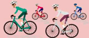
絵本の里けんぶち ぐるっとライド

開催日: 令和5年7月上旬 問い合わせ先: 0165-26-9022 ぐるっとライド実行委員会 (剣淵町役場町づくり観光課内)