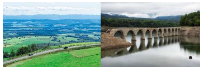
ナイタイ高原牧場ナイタイテラスは 10月末でクローズ!

十勝の北部にある上士幌町は、畑作、酪農などの農業が盛んな町。観光スポットとしては、日本一広い公共牧場ナイタイ高原牧場や源泉かけ流しの温泉街「ぬかびら源泉郷」があります。旧国鉄士幌線コンクリートアーチ橋は北海道遺産にも登録されており中でもタウシュベツ川橋梁は湖の水位によって見え隠れすることから「幻の橋」と呼ばれ、全国から多くのファンが押し寄せています。