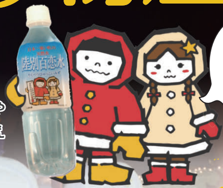
しばれ君とつらちゃん

日本一寒い町・陸別町から特産品をお届けします！ 山菜や鹿肉の加工品、りくべつ牛乳を使ったプリンや ポタージュースなど陸別産の人気商品を取りそろえて お待ちしております。ぜひお立ち寄りください。