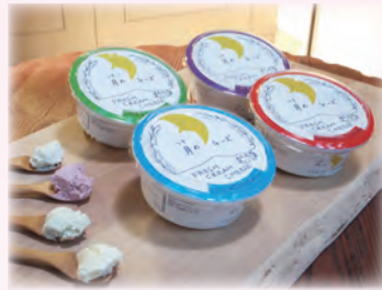
フレッシュクリームチーズ

童話村のいも・かぼちゃ・だいこん/ ハーブティー / 飲むチーズ / フレッシュクリームチーズ / シフォンケーキ / カシスジャム / バジルペースト / ミントスプレー / パンプキンパウダー / スイートコーンパウダー / 野菜フレーク (パンプキン・スイートコーン・ポテト・キャロット) ※農産物は収穫により変更、または出品できない可能性があります