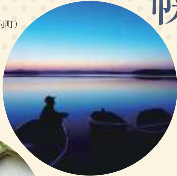
朱鞠内湖 (幌加内町)