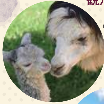
ビバアルバカ牧場 (剣淵町)