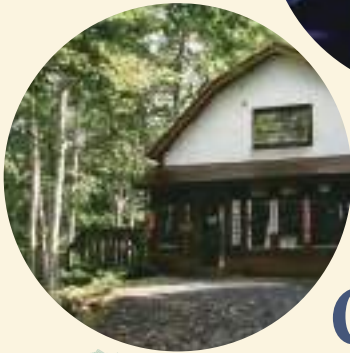
塩狩峠記念館 (和寒町)