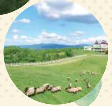
羊と雲の丘 (士別市)